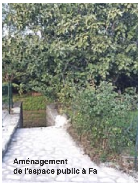
Aménagement de l'espace public à Fa