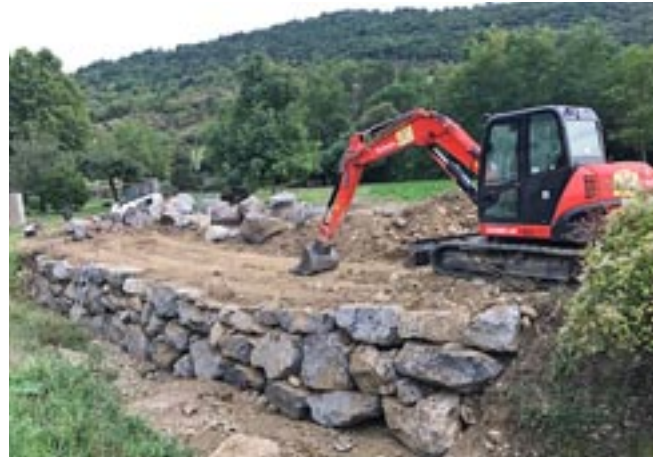
▲ Enrochement du ruisseau des Bernots à Rouvenac