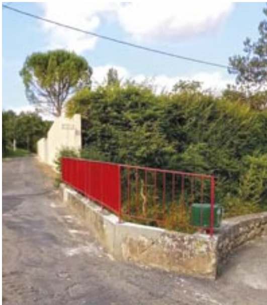
▲ Parapet pour la sécurisation à Fa