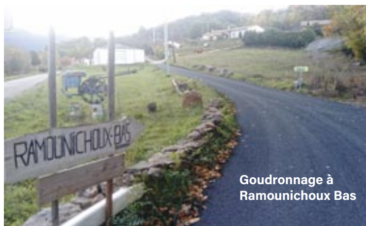
Goudronnage à Ramounichoux Bas