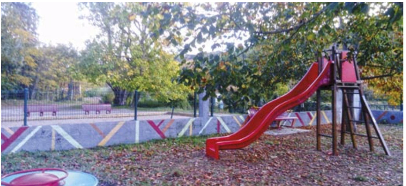
▼ Aire de jeux à Fa