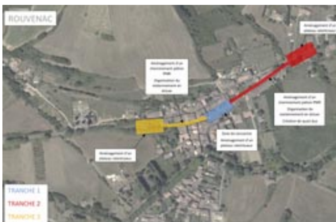
▼ Traversée de Rouvenac

Le présent projet, de par son importance, sera réalisé en trois tranches et planifié sur plusieurs années.