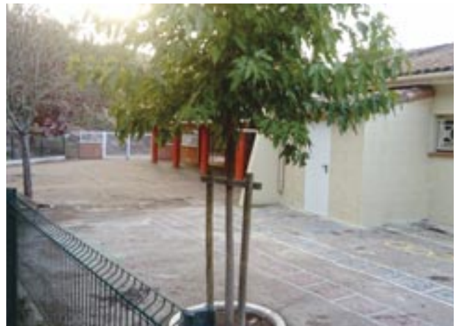
▲ Local de rangement à l'école