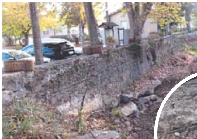
▲ Le Faby à Rouvenac en cours de travaux