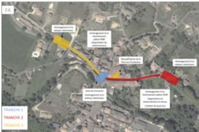
▲ Traversée de Fa