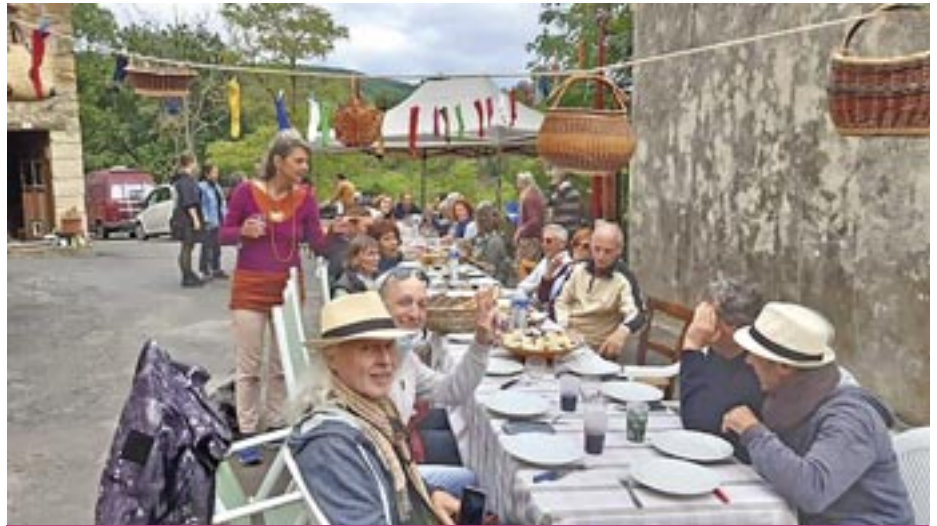
Ramounichoux fait sa fête

Les habitants avaient préparé une bonne salade de riz, des grillades et des plats à partager. La mairie, quant à elle, avait offert l'apéritif. Ambiance chaleureuse et musicale grâce à des chansons que certains convives ont spontanément interprétées au cours du repas et à des histoires contées par Guigo.