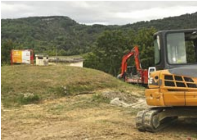
▲ Électrification du château d'eau à Rouvenac