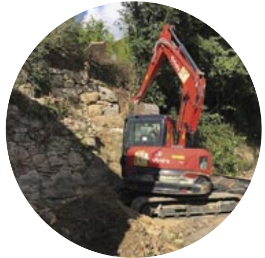
▲ Enrochement à Rouvenac chemin de Toziels