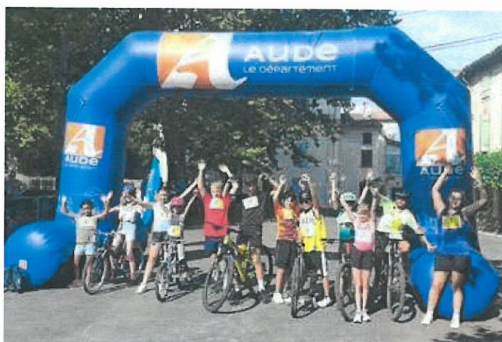
Vétathlon Val du Faby - Futurs grands - août 2022

Maximum d'engagés : VINGT (20) - soit DIX (10) équipes.