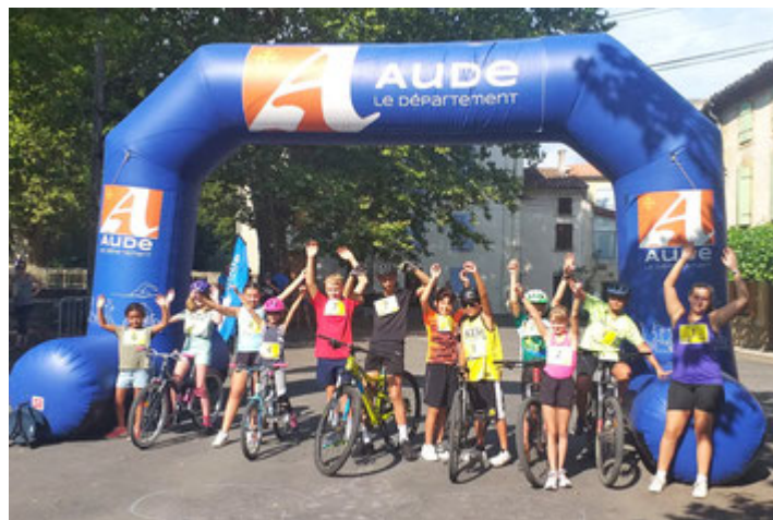
Vétathlon Val du Faby - Futurs grands - août 2022

Récompenses: Le lendemain à l'issu de la course des Grands.