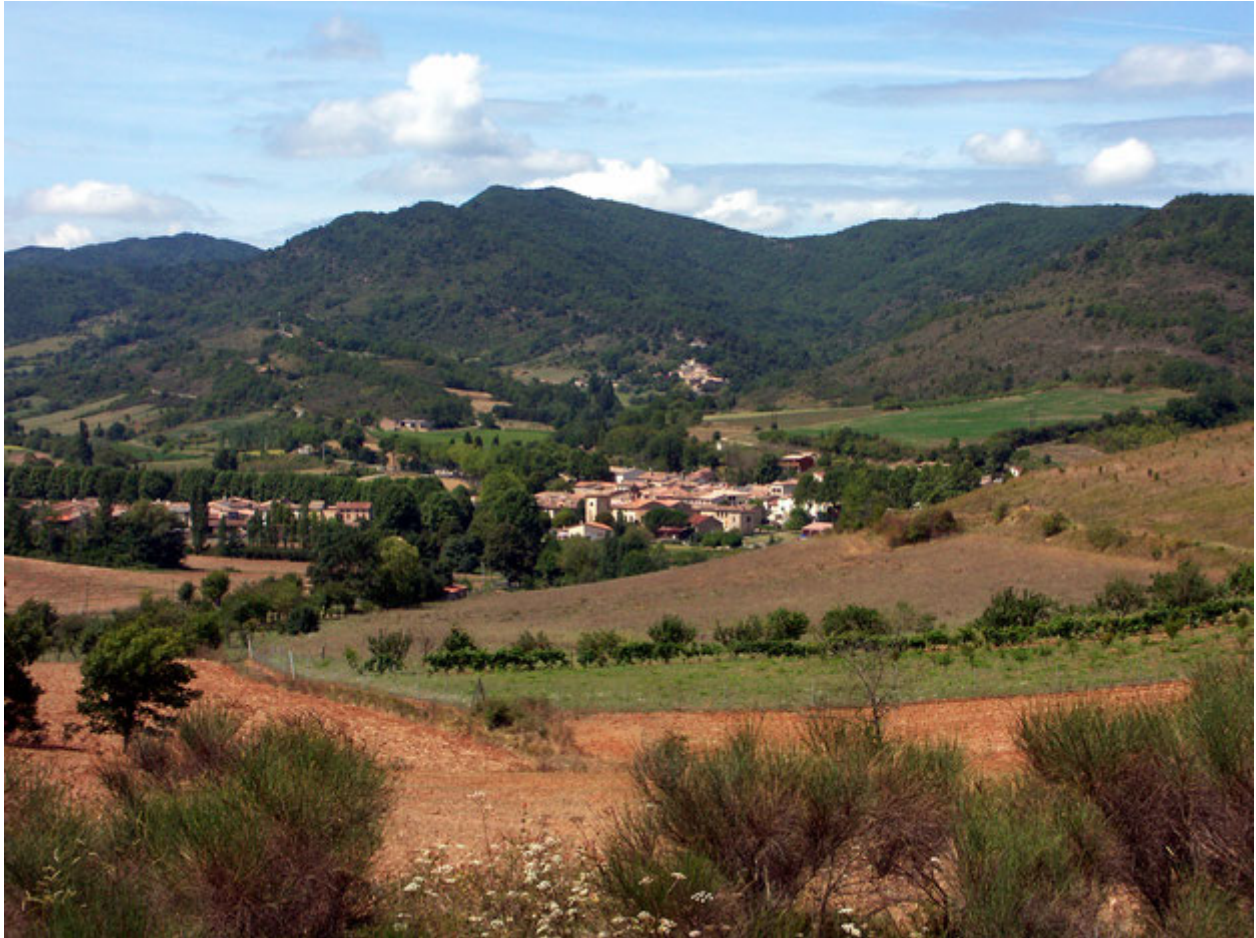
Village de Rouvenac 11260 Val du Faby

Ravitaillements : Détaillés plus avant dans le dossier.